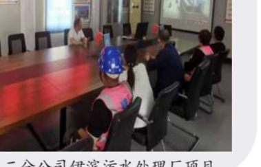
二分公司伊滨污水处理厂项目