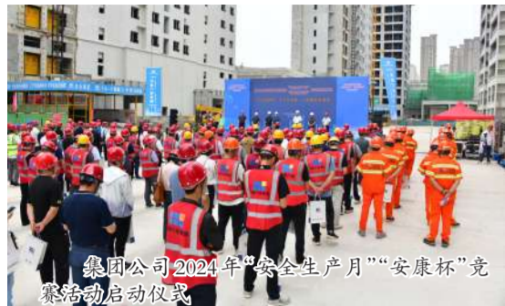
集团公司2024年“安全生产月”“安康杯”竞赛活动启动仪式