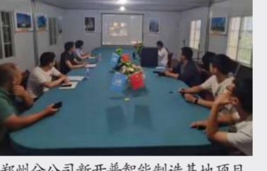
郑州分公司新开普智能制造基地项目