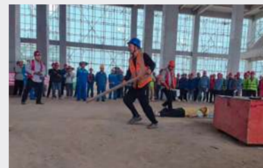
郑州分公司黎明化工厂开展触电应急演练