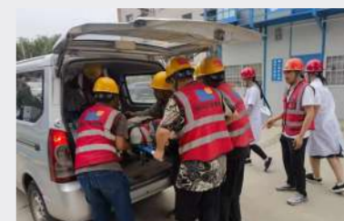
郑州分公司美盛教育港湾熙水苑项目开展高处坠落应急救援演练