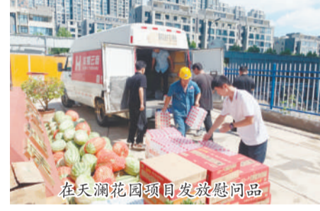
在天澜花园项目发放慰问品