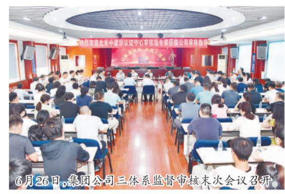
6月26日,集团公司三体系监督审核技术次会议召开。

审核组通过访谈、查阅(证据、依据)、现场巡察等方式对集团公司领导、员工代表及9个职能部门、设计院和2个工程项目的管理体系运行有效性、设计进行了认真细致的审核。