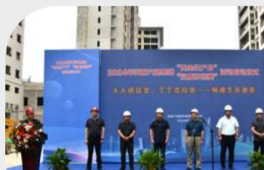
八分公司都会龙园项目