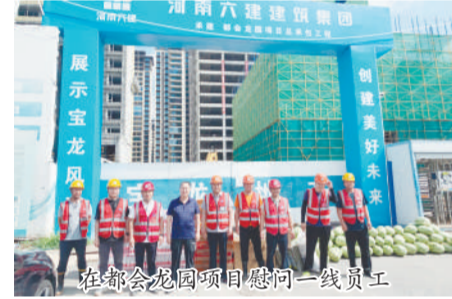
在都会龙园项目慰问一线员工