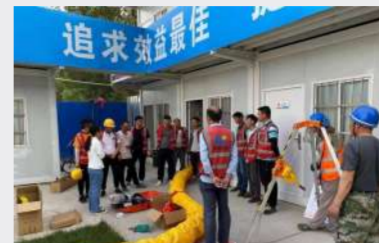
科技分公司焦作恒大翡翠华庭项目有限空间应急救援演练