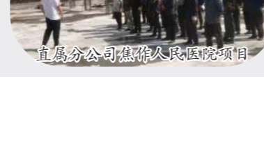
直属分公司焦作人民医院项目