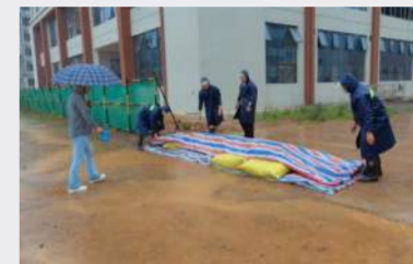
七分公司新安县二职高专开展防汛救援演练