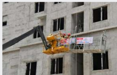
八分公司都会龙园项目开展吊篮安装故障应急救援演练