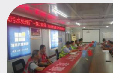
二分公司伊滨污水处理厂项目