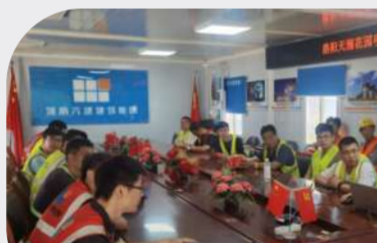
十六分公司天润花园项目