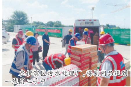
在伊滨区污水处理厂,将慰问品送到一线员工手中