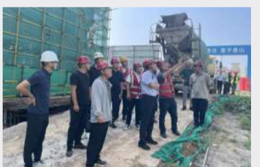
八分公司都会龙园项目检查工作