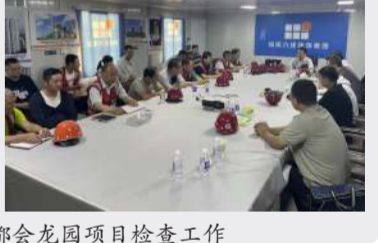
八分公司都会龙园项目检查工作