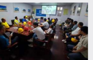
直属分公司焦作人民医院项目