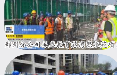
郑州分公司美盛教育港湾熙水苑项目