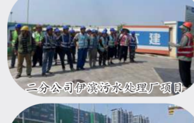
二分公司伊滨污水处理厂项目