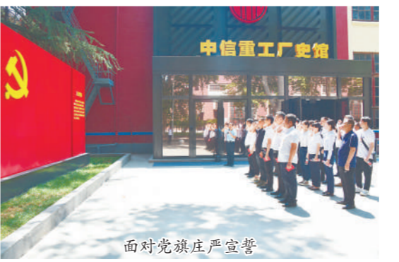
面对党旗庄严宣誓