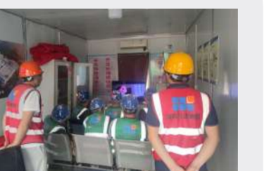
八分公司珑樾小区项目