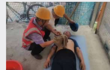
九分公司长葛恒大翡翠华庭开展中暑应急演练