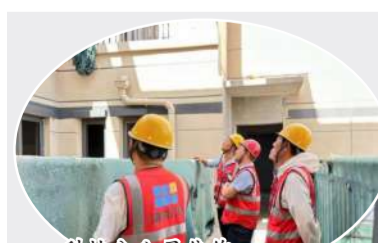
科技分公司焦作恒大翡翠华庭项目