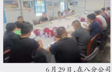
八分公司都会龙园项目检查工作