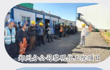
郑州分公司黎明化工厂项目