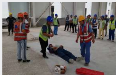
西安分公司济源玉川静脉产业园建设项目开展中暑应急演练