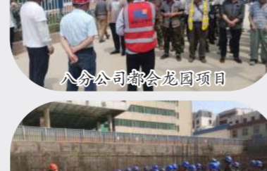
八分公司都会龙园项目