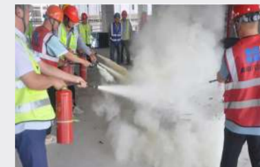
郑州分公司新开普智能制造产业基地项目开展火灾及逃生疏散应急演练