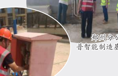
科技分公司孟津恒大云湖上郡项目