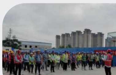
科技分公司焦作恒大翡翠华庭项目