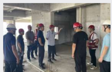
八分公司都会龙园项目检查工作