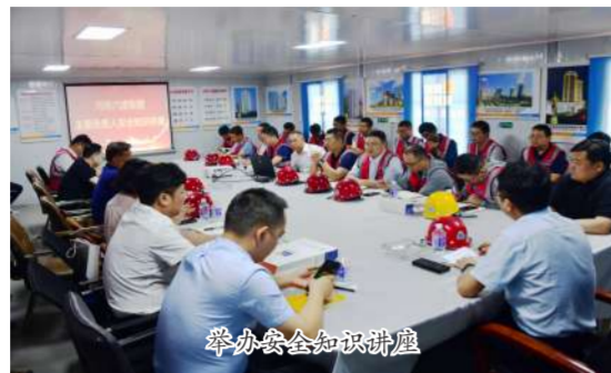
举办安全知识讲座

今年6月是第23个全国“安全生产月”，活动主题是“人人讲安全、个个会应急——畅通生命通道”，为深入贯彻国家和省市2024年“安全生产月”工作总体部署，增强全员安全意识，筑牢建筑施工安全生产防线，6月5日上午，集团公司2024年“安全生产月”暨“安康杯”竞赛活动启动仪式在都会龙园项目现场举行，对施工现场安全文明施工标准化、双重预防体系、智慧化工地建设等工作做出安排部署并进行了高处作业吊篮故障应急救援演练。各分公司、项目部积极开展形式多样、内容丰富的“安全生产月”活动，加大隐患排查治理力度，进一步强化全员对安全工作重要性的认识，完善了安全管理机制，提高了安全生产的管理水平和防范事故的能力，有效的控制了各类事故的发生，保证了安全生产。现将河南六建集团2024年“安全生产月”活动的主要做法、措施总结如下：