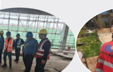
郑州分公司黎明化工厂项目