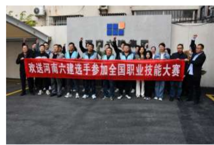
10月,公司两名选手参加2024年全国住房城乡建设行业职业技能大赛。