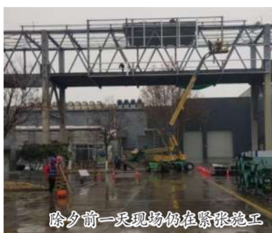
除夕前一天现场仍在紧张施工