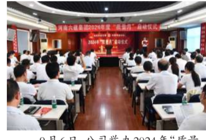
9月6日,公司举办2024年“质量月”启动仪式。