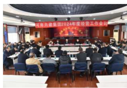
12月6日,公司2024年度经营工作会议召开。