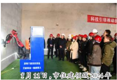
1月11日,市住建领域2024年智能建造观摩会在洛阳天瀾花园项目现场举行