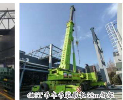
600T吊串吊梁最长38m桁架