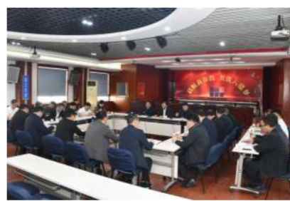
10月15日,公司召开办公会议。