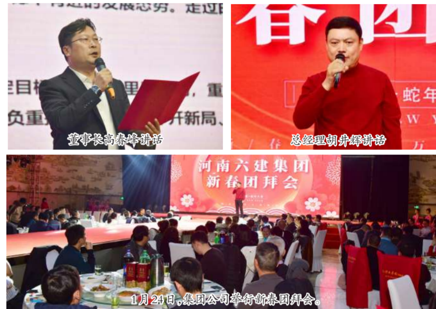
1月24日,集团公司举行新春团拜会。

的新春祝福,他说:过去的70年,一代代六建人风雨兼程、薪火相传,共同谱写了六建的光辉篇章。2025年,国家出台了一系列促进经济发展的政策,建筑业将迎来新的发展机遇,我们要坚定信心、抓住机遇,争取有所突破,大力弘扬六建企业文化,讲好六建历史,说好六建故事,团结一致,共同努力,创造六建美好的明天。