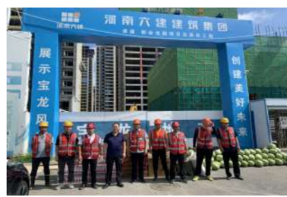
7月,集团公司开展“夏送清凉”慰问活动。