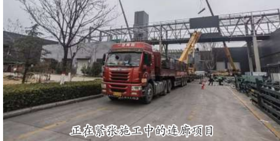
正在紧张施工中的连廊项目

在郑州市经开区宇通客车节能与新能源客车生产基地输送连廊项目犹如一座崛起的钢铁巨龙,承载着宇通客车迈向高效生产新征程的殷切期望。项目南北长度331.3米,高22.2米,采用二层结构设计,每一处细节都彰显着对品质的极致追求,为节能与新能源客车的生产提供坚实保障。钢结构二分公司在工程建设中,贯彻以用户为中心的理念,积极组织,抢抓工期,为圆满完成施工目标而奋战不止。 风雨兼程,砥砺前行。2025年春节前夕,寒风凛冽,雨雪交加,但施工现场却热火朝天。施工工人们舍小家、为大