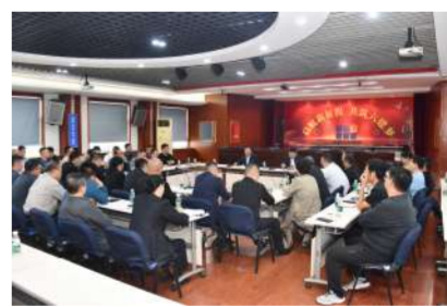
10月18日,公司召开二级单位、机关部门负责人会议。