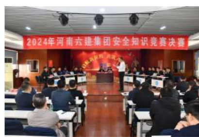
11月6日,公司举行2024年安全知识竞赛决赛。