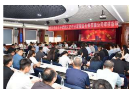
6月,公司三个管理体系通过中建协认证中心监督审核。