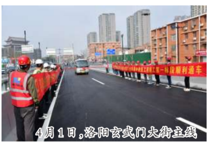
4月1日,洛阳玄武门大街主线桥梁全线通车