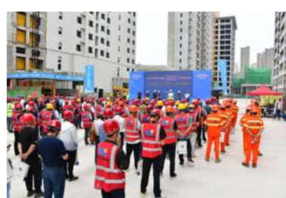
6月5日,公司举办“安全生产月”启动仪式。