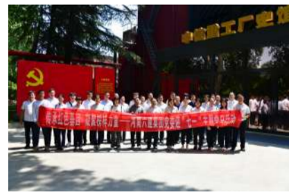
6月28日,集团公司党委开展主题党日活动。