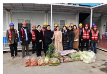
12月19日,集团公司工会开展冬送温暖活动。