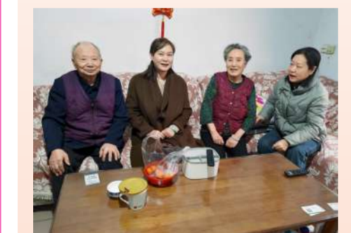
看望慰问退休劳模