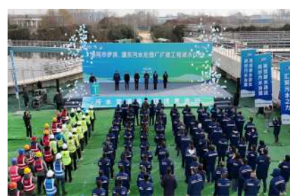
12月30日,公司承建的伊滨污水处理厂二期二阶段工程举行通水仪式。