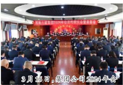
3月15日,集团公司2024年会员代表大会暨表彰会召开